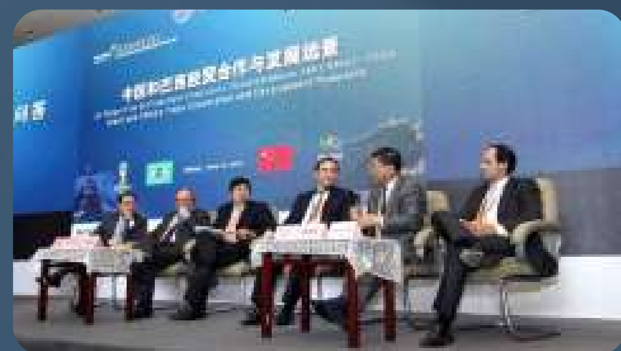
Painel de discussão e perguntas e espostas