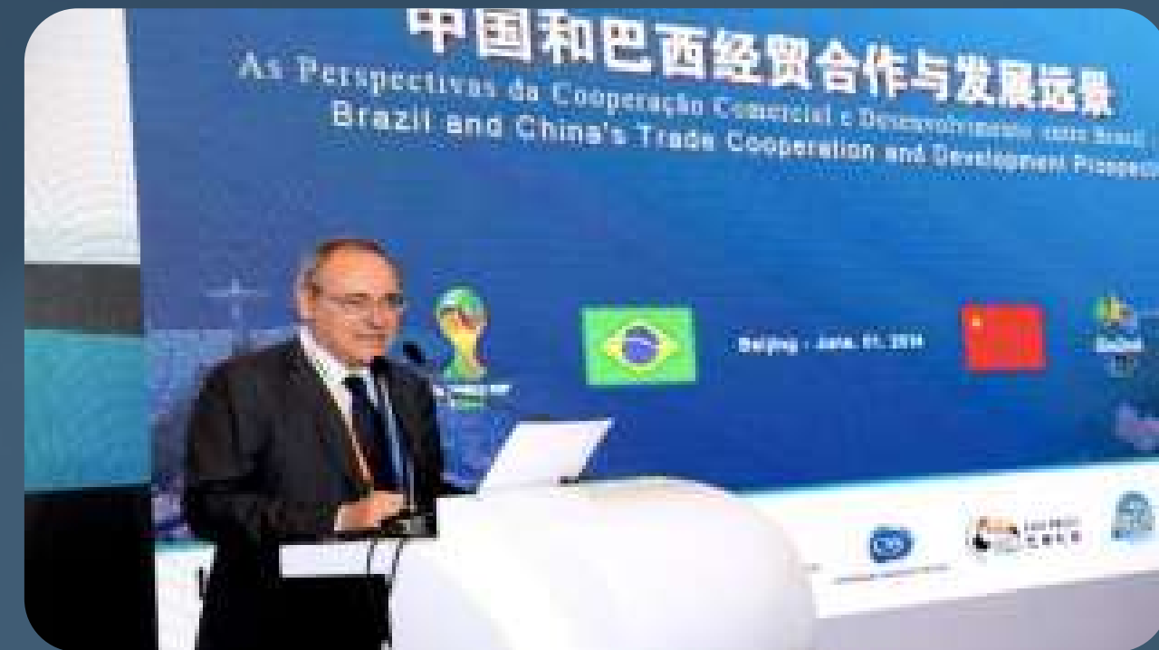
Mr. Luigi Nese (Presidente da Confederação Nacional de Serviços - Brasil - CNS)